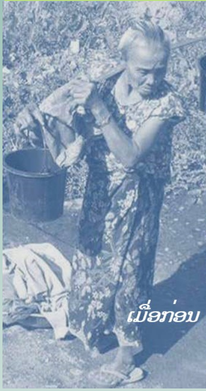
ເມື່ອກ່ອນ