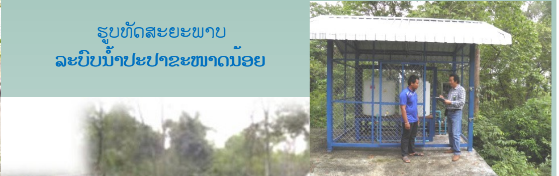
ຮູບທັດສະຍະພາບ ລະບົບນໍ້າປະປາຂະໜາດນ້ອຍ