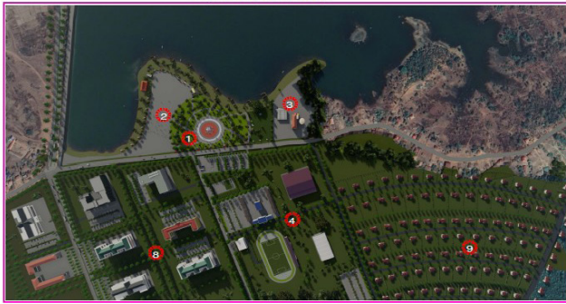
ຖານທີ່ການຈັດສັນແລະອຸປະກອນເສຍສິນສາມສ່ວນ ແລະ ສະຖານີປັບສົ່ງໂລຫານ